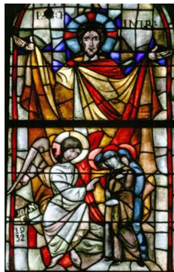
< Verrijzenis van Christus - drie vrouwen bij het graf

Heer, bevrijd mij van de eeuwige dood op die verschrikkelijke dag, wanneer hemel en aarde geschokt zullen worden, wanneer Gij met vuur de wereld komt oordelen. Ik beef, en ik ben bang, voor het oordeel dat zal komen, en voor de naderende toorn, wanneer hemel en aarde geschokt zullen worden.