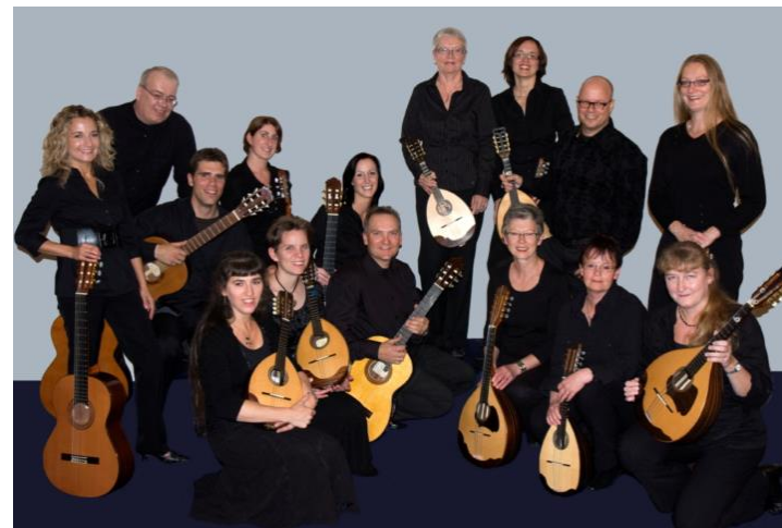
Mandoline Ensemble “The Strings”