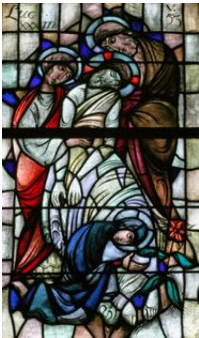
< Graflegging van Jezus

Gegroet waarachtig lichaam geboren uit de Maagd Maria dat werkelijk heeft geleden en voor de mens geofferd is aan het kruis. Uit wiens doorboorde zijde water met bloed vloeide. Wees voor ons een voorsmaak tijdens de beproeving van de dood. O Jezus zoet, O Jezus getrouw, O Jezus, Zoon van Maria.