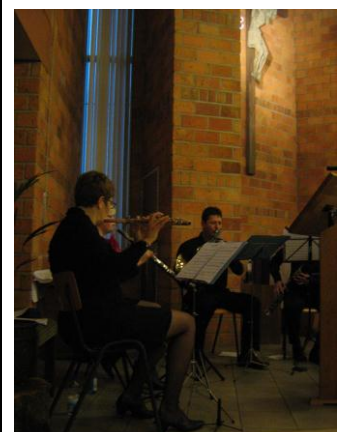
blaaskwintet "Wëndjkrach 5"