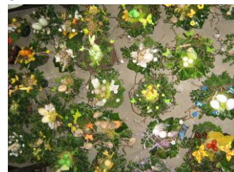
in totaal waren er 111 bestellingen