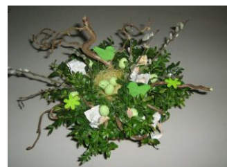
het resultaat mag er zijn