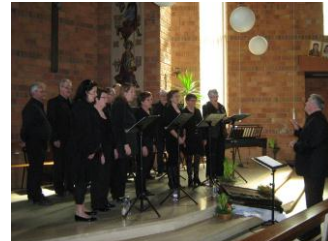
vocale ensemble Vocomotion