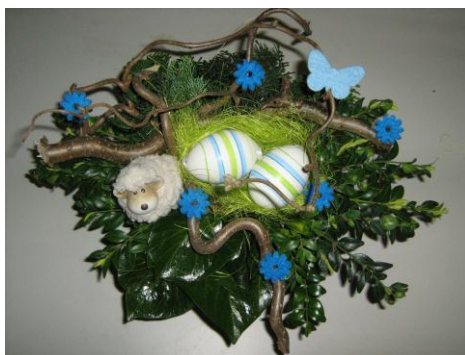
het eindresultaat was prachtig