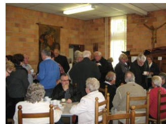
na het concert genoot eenieder van een kopje koffie / thee, frisdrank of een glaasje wijn