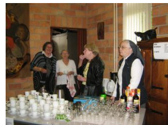
de vrijwilligers hadden alle werkzaamheden onder controle