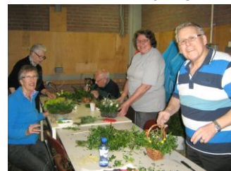
vrijwilligers werken met veel plezier aan de paasstukjes