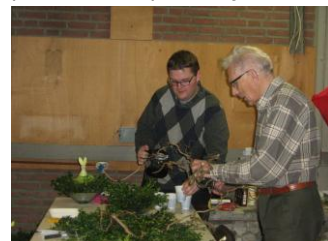
de paasstukjes werden zorgvuldig gedecoreerd