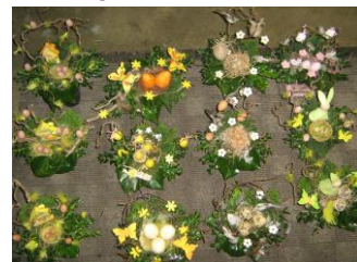
het was voor eenieder een genot om alle paasstukjes te bewonderen