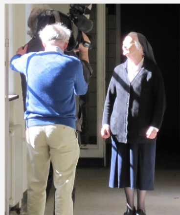
Filmopnames in het Franse Klooster