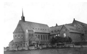
De Kapel en het Franse Klooster rond de jaren 30 van de 20ste eeuw

Wat betreft de toekomst van de Kapel bestaat er een specifiek beleid. De raad zal beslissen wat er met de kapel gaat gebeuren. Tijdens de raadsvergadering van 13 september 2012 gaven alle fracties aan voorstander te zijn voor het behoud van de Kapel, gezien haar artistieke en emotionele waarde voor Sittard en haar omgeving.