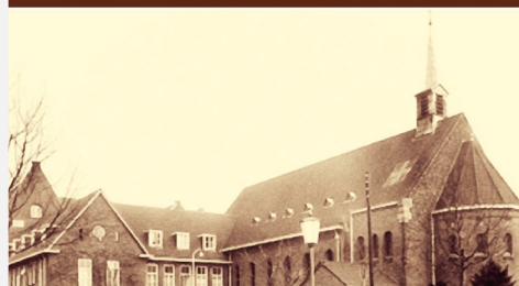
Visiedocument voor het behoud en herbestemming van het Franse Klooster

Het visiedocument is naar het College van Burgemeester en Wethouders en naar de gemeenteraad gestuurd. De komende tijd zal de stichting aan de hand van dit visiedocument in gesprek gaan met alle hierboven genoemde partijen.