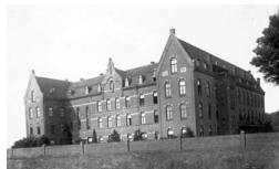
Het Franse Klooster omstreeks begin 20ste eeuw