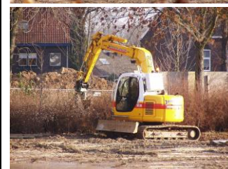
Wethouder Guyt verwijderd het laatste stukje schutting