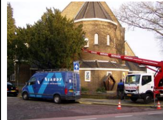
Foto's conservatie glas-in-lood ramen Kapel op 12 en 14 december 2013