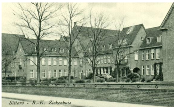
Sittard - R.-K. Ziekenhuis historische foto hoofdingang ziekenhuis Goddelijke Voorzienigheid

Beste Vrienden van het Franse Klooster, Voor u ligt de tweede nieuwsbrief van Stichting Behoud Franse Klooster. In deze nieuwsbrief staan weer verschillende actualiteiten beschreven aangaande het Franse Klooster, de Kapel en het Orgel. De komende tijd zal de herbestemming en de toekomst van het Franse Kloostercomplex in de media centraal staan. Zoals u weet zal het terrein een tijdelijke herbestemming krijgen met gras, bankjes, fietspad, etc. De bestaande bomen zullen gehandhaafd blijven. Waarschijnlijk zal het terrein (inclusief Franse Klooster) medio het voorjaar door de gemeente Sittard – Geleen overgenomen worden. Het is natuurlijk een belangrijke opdracht om een goede herbestemming in het Franse Klooster en kapel te vestigen. De stichting heeft momenteel een werkgroep in het leven geroepen die zich gaat buigen over dit onderwerp. De gemeente Sittard – Geleen heeft een limiet van één jaar (vanaf het moment van overname) gesteld om een herbestemming voor het complex te vinden. Het is een enorme klus, maar wij gaan ervoor!