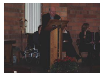
inhoudelijk moment door deken van Rens