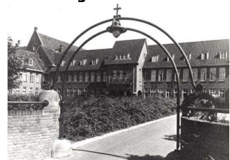
Historische foto's Goddelijke Voorzienigheid