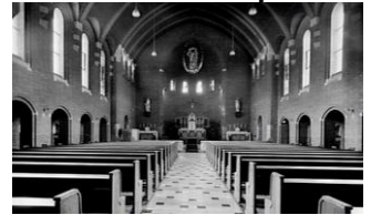
Historische foto's Kapel