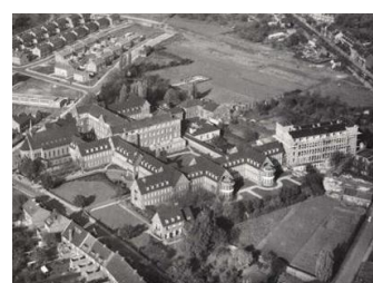
het ziekenhuis in vroegere tijden