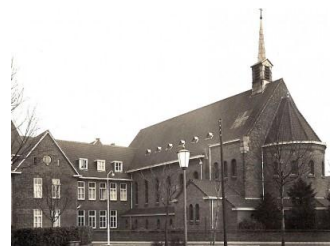
de kapel in vroegere tijden