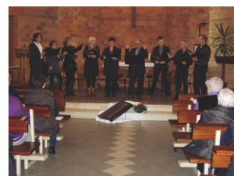
vocale ensemble Alouette