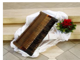
het verbrande klavier met het "leven" van een bloemstuk als symbool voor de toekomst